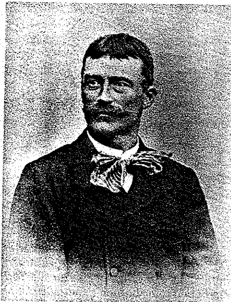
Ludwig Purtscheller