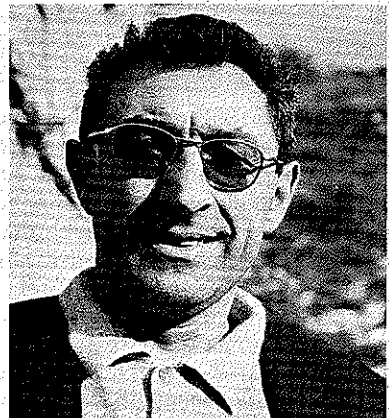
Guido Magnone um 1968 in Trient

Vita *22. Februar 1917 Paris; kaufmännische Ausbildung; technischer Direktor der »Union Nationale des Centres de