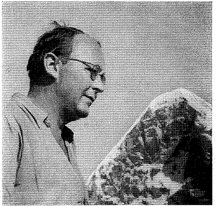
Ein Schnappschuß vor der Eiger-Nordwand